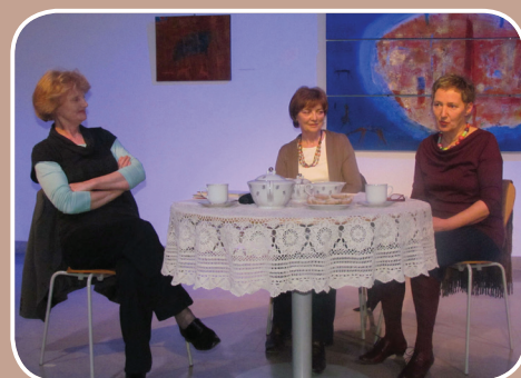
Odraslim pripovedujejo tudi domači pravljíčarji.