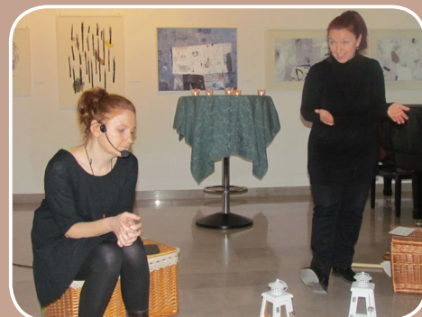
Pravljíce niso samo za otroke, od januarja letos jim lahko prisluhnejo tudi odrasli.