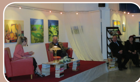
Že vrsto let v knjižnica organizira bralno značko za odrasle, v okviru katere potekajo tudi literarni večeri in srečanja z avtorji.